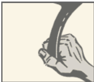
Der korrekte Griff

Halte den Bumerang so, dass die gewölbte, meist farbige Seite zu dir zeigt. Halte ihn an einem der Flügelenden fest zwischen Daumen und Zeigefinger. Hole nach hinten aus, als wolltest du einen Schneeball werfen. Werfe den Bumerang dann mit einer "peitschenartigen" Bewegung über die Schulter. Auf keinen Fall wie eine Frisbee werfen!