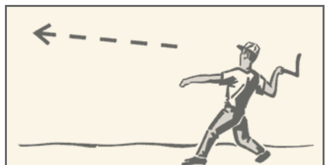
Horizontwinkel von 5^{\circ} - 10^{\circ} zum Boden

Werfe in einem Winkel von 5^{\circ} - 10^{\circ} zum Boden. Also leicht schräg nach oben. Werfe den Bumerang also keinesfalls steil nach oben, sondern fast parallel zum Boden!